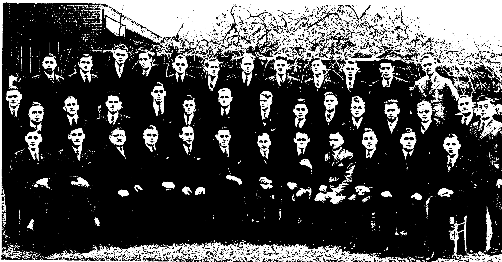
Bestuur en leden van Etten's Mannenkoor.

Het antwoord ligt opgesloten in deze drie woorden: